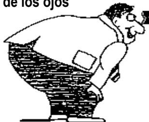
Los DESEOS de los ojos