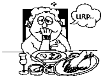
Los DESEOS de la carne

No améis al mundo, ni las cosas que están en el mundo. Si alguno ama al mundo, el amor del Padre no está en él. Porque todo lo que hay en el mundo, los deseos de la carne, los deseos de los ojos, y la vanagloria de la vida, no proviene del Padre, sino del mundo. I Juan 2:15-16